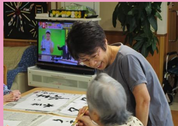
レクリエーション補助（介護施設）