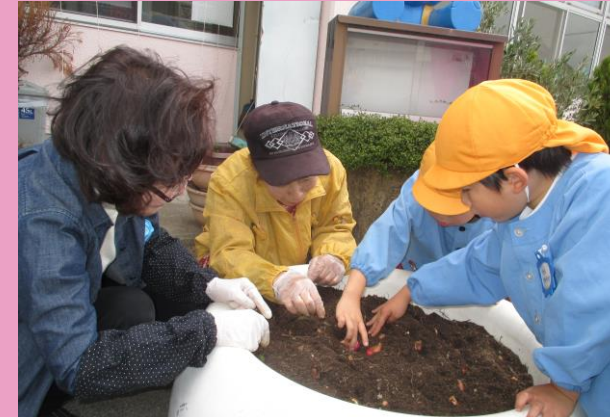
園庭の管理（保育所）