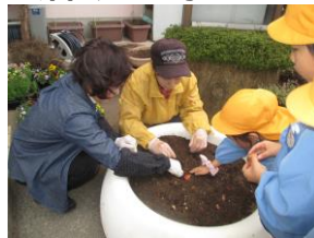
幼稚園・保育所(園) こども園