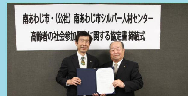
協定締結（令和2年2月締結式）