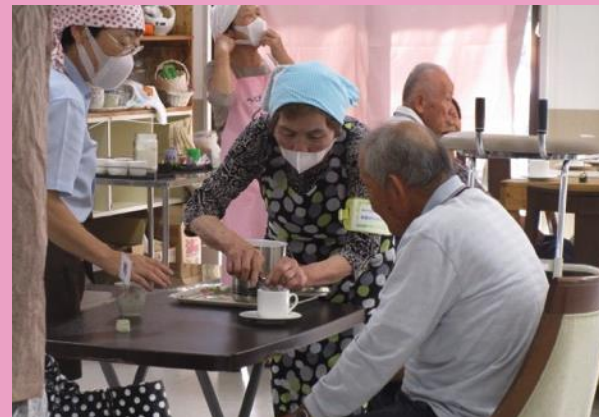
喫茶補助（介護施設）