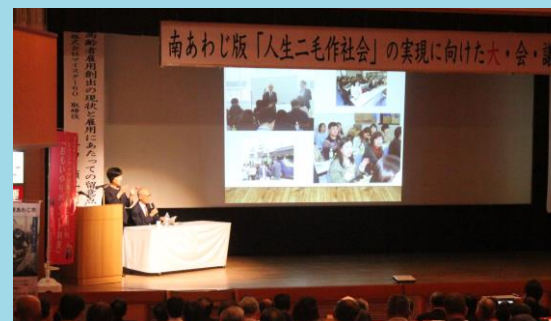
シンポジウム（令和1年10月実施）