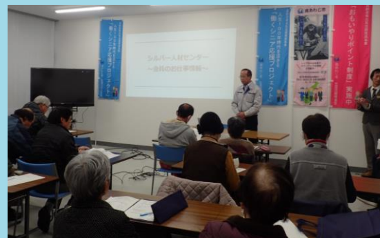
シニアのお仕事フェア2020（令和2年1月開催）